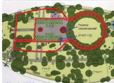
Okruh 1000 m