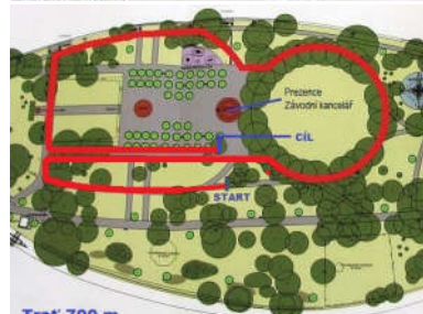
Trat' 700 m