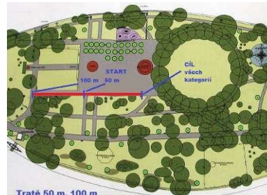
Tratě 50 m, 100 m