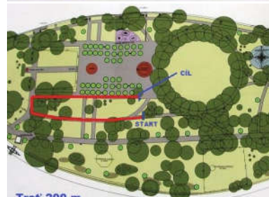
Trat' 200 m