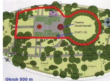
Okruh 500 m